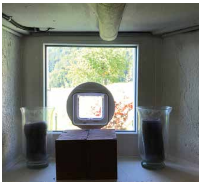
Kellerfenster mit Katzentörli