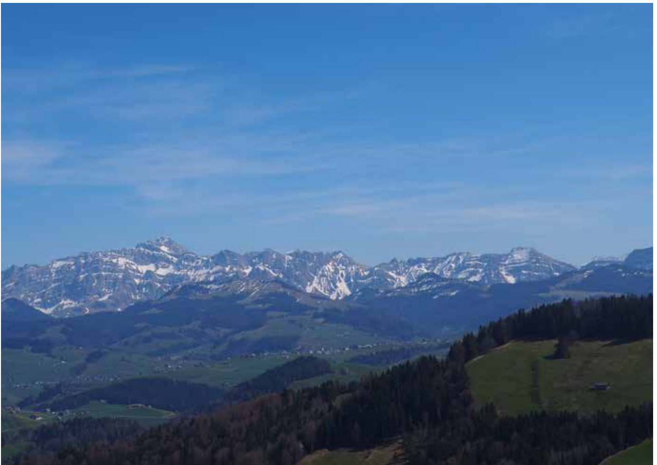
Aussicht von der Ruine Neutoggenburg Richtung Alpstein mit Säntis