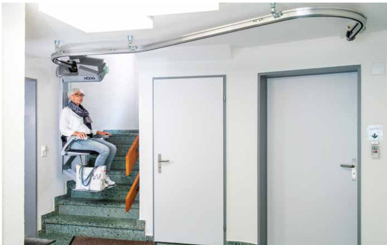
Deckenlift im Oberhof

Aufgrund Corona musste Kreatissimo, die im Erdgeschoss eingemietete Geschenkboutique, ihre Türen vom 17. März bis 11. Mai schliessen. Wir sind den Mietern für diese Zeitspanne mit einer Mietzinsreduktion von 70% entgegengekommen.