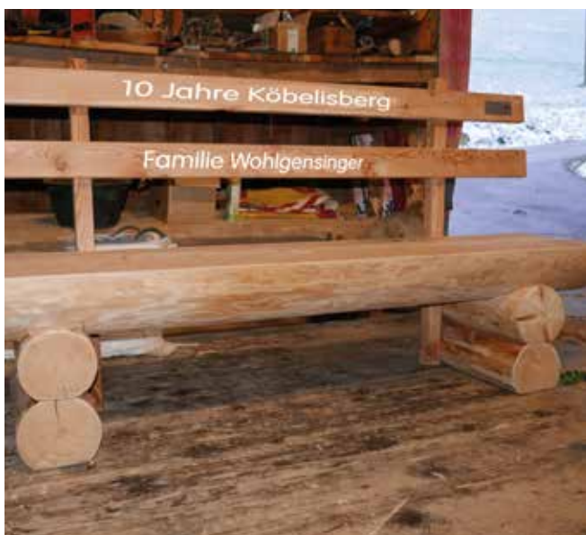
Jubiläumsgeschenk an die Pächterfamilie

Nachdem in den letzten Jahren der Fokus bei der Erneuerung gemäss Liegenschaftsanalyse von 2017 beim Hausteil Süd lag, wurde durch Looser Wattwil AG, Fensterbau, Schreinerei, im Berichtsjahr ein erster Teil der Fenster im Haus Nord ersetzt. Der Ersatz war eigentlich erst für's 2021 geplant. Die Arbeiten waren aber bereits ausgeschrieben und offeriert. Der Grund für das Vorziehen lag darin, dass die Balkontüre nicht mehr dicht war und somit ein dringender Handlungsbedarf bestand. Dies wurde zum Anlass genommen, alle Fenster der Westseite (Wetterseite) zu ersetzen. Zudem wurden die Kellerfenster ersetzt, um das «Katzentörli», welches bisher bei der Balkontüre eingebaut war, neu in einem Kellerfenster zu platzieren. Die Kosten beliefen sich auf CHF 11 829.60 (9635/34300). Um diesen Betrag wird sich unser Aufwand im 2021 reduzieren.