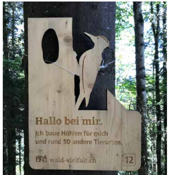
Station des Walderlebnis-Parcours

Im Rahmen der weiteren Modernisierung des Betriebs ist es geplant, im 2021 einen Kleider Trocknungsschrank anzuschaffen. Bisher fehlte die Möglichkeit, die durch den Arbeitseinsatz nass gewordenen Kleider und Schuhe über Nacht zu trocknen. Mit der Anschaffung eines Trocknungsschranks stehen Arbeitskleider und -schuhe am Morgen vor Arbeitsbeginn wieder in optimalem Zustand zur Verfügung. Nebst dem Komfortgewinn für die Forst- warte wird durch die schonende Trocknung auch die Lebensdauer von Schuhen, Handschuhen und Kleidung erhöht. Gemäss den bereits eingeholten Offerten dürften die Kosten bei rund CHF 12000 liegen (8200/31100). Zusätzlich sind in diesem Konto weitere CHF 9000 vorgesehen, zur eventuellen Anschaffung eines mobilen Containers zur sicheren Lagerung von diversen Flüssigkeiten wie z.B. Treibstoffe und Öle.