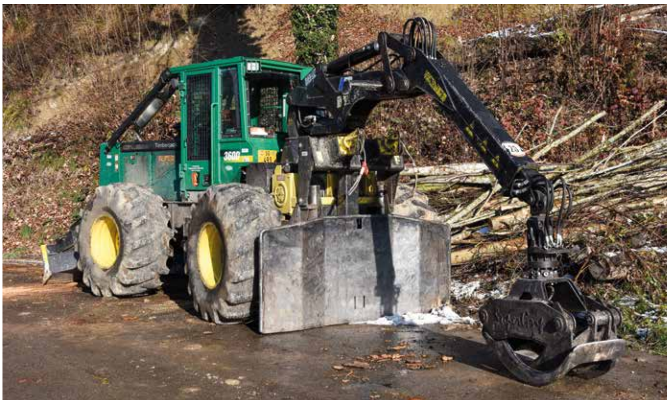
Der auf Null abgeschriebene Forstraktor