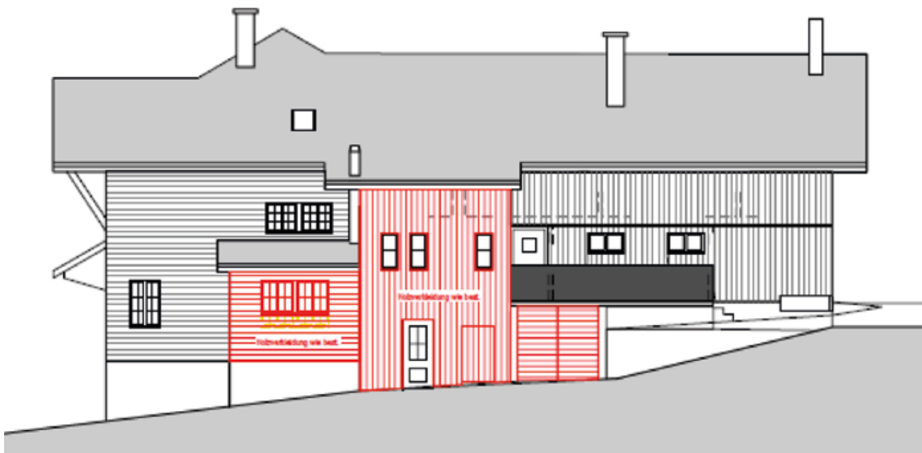
Ansicht Ostfassade Köbelisberg

Im Hausteil Nord werden die restlichen Fenster inklusive eines Dachfensters durch Holz-Alu-Fenster ersetzt. Weiter wird eine neue Haustüre eingebaut. Dafür ist ein Betrag von CHF 26 000 budgetiert (9635/34300).